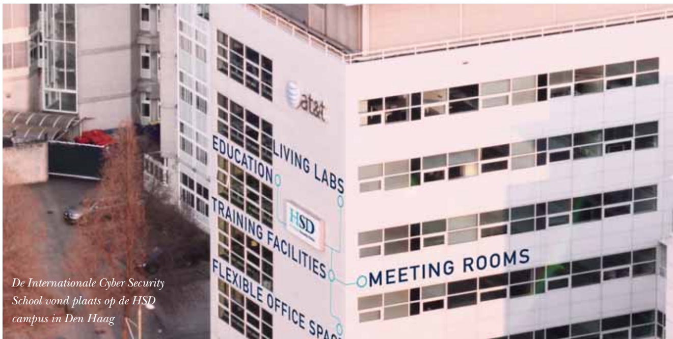
De Internationale Cyber Security School vond plaats op de HSD campus in Den Haag

denten opgeleid in cyber security voor internationale organisaties. Met als doel om hen voor te bereiden op uitdagingen aangaande cyber security in complexe situaties.